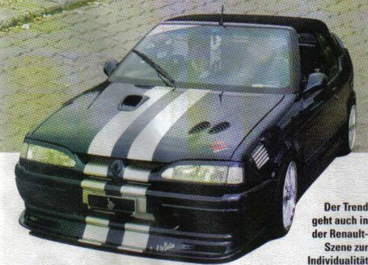
Der Trend geht auch in der Renault-Szene zur Individualität