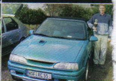
Natürlich brachte die AUTOTUNING auch wieder drei Sonderpokale mit nach Steinsdorf